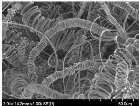
2. ábra: szén mikrospirálok pásztázó elektronmikroszkópos felvétele

A szén mikrospirálok (2. ábra) szelektivitásának növelésére optimalizáltuk a kísérletet: a katalizátor készítése során szuszpenziót készítünk a nikkel-oxid nanorészecske és etanol segítségével, mely szuszpenziót azután felcseppentünk szilícium lapkára, és megszáritottuk 70^\circ\text{C} -on. A szintézis során vizsgáltuk a képződő terméket különböző szintézishőmérséklet és gázáramlási sebességek mellett. Az eredmények azt mutatják, hogy a szén mikrospirálok nagy hozammal és >90\% szelektivitással keletkeznek az alábbi paraméterek alkalmazásával: 750\text{-}780^\circ\text{C} , nitrogén 300 \text{ ml}/\text{min} , acetilén 110 \text{ ml}/\text{min} , 70 \text{ ml}/\text{min} hidrogén, 2 \text{ ppm} tiofén koncentráció mellett.