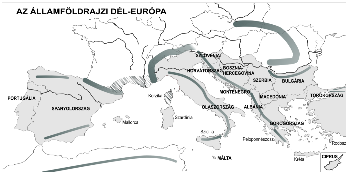
1. ábra: A vizsgálatban alkalmazott Dél-Európa lehatárolás. Szerk.: Pap N. 2007

A kutatás keretében igyekeztünk feltárni az érintkezési pontokat, a meghatározó folyamatokat. Megközelítésünk geográfusi és nem kultúrtörténeti. Nem az eseteket kerestük, hanem a térbeli folyamatokat elemeztük, a földrajzi mintázatokat igyekeztünk megrajzolni, mellette pedig a térben kapcsolódó társadalmak (elsősorban a kitüntetett figyelmet kapott olasz és a magyar) eltérő térélményét, percepcióját is összevetettük. Szükséges volt időbeli kereteket is megszabni. A legszűkebben vett vizsgálat mintegy 20 évet fogott át, 1986-tól 2005-ig terjedően. Így a magyar rendszerváltozás, valamint az euro-atlanti integrációs folyamat időszakában tudtunk képet kapni, illetve adni a változásokról.