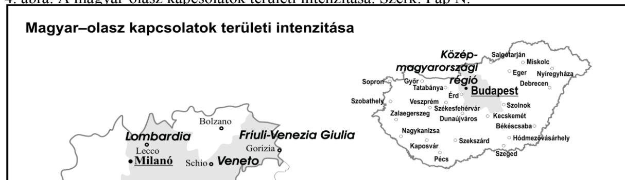
4. ábra: A magyar-olasz kapcsolatok területi intenzitása. Szerk: Pap N.

A magyar városhálózatban kiemelt csoportot, az ún. megyei jogú városok képeznek. Ez a város csoport jelenik meg a nemzetközi-kapcsolati területen. Külkapcsolataikban az olasz települések súlyát az alábbi ábra mutatja be. Sajátos következtetés, hogy kapcsolataikban – és a legjelentősebb magyar városok körében – az Emilia-Romagna-i települések dominálnak. A 14 jelzett kapcsolat fele ennek a régióknak a településeivel kötött. A további kapcsolatok is ugyanazon észak-olasz és középső fekvésű települési csoportban, illetve régióban jelentkeznek (Friuli-Venezia-Giulia, Veneto, Lombardia, Trentino Alto-Adige), amelyben a gazdasági kapcsolatok.